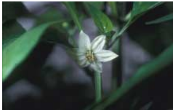
Paprikabloem met stuifmeel (links) en paprikabloem nadat stuifmeel door bijen is verzameld.

Een regelmatige controle van de activiteit van bestuivende insecten is belangrijk. De controle moet plaatsvinden op basis van het waarnemen van het bloembezoek en van het aantal bestuivende insecten dat met stuifmeel terugkeert bij het bijenvolk. Bij eenslachtige bloemen moet erop gelet worden dat de bestuivers zowel mannelijke als vrouwelijke bloemen bezoeken. Bij donker en koud weer is de activiteit van de volken minder dan bij zonnig en warm weer. Dit is geen probleem, omdat bij lage temperaturen het bloeiproces ook vertraagd wordt. Als er onder zonnige omstandigheden weinig of geen vliegactiviteit is, verdient het aanbeveling de bijenhouder in te schakelen om de bijenvolken te controleren.