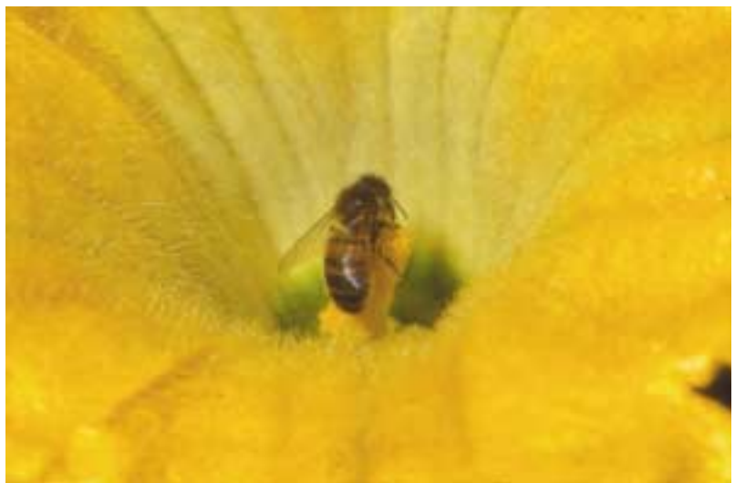
Bij verzamelt stuifmeel van mannelijke courgettebloem.

Sommige mensen vertonen allergische reacties zoals koorts, misselijkheid of ze raken zelfs in een shock. In dat geval moet onmiddellijk een arts worden gewaarschuwd. Bij gebruik van bijen en hommels voor bestuiving bij bedekte teelten gedragen de bijen en hommels zich meestal niet agressief. Snelle bewegingen en vreemde geuren kunnen deze insecten wel agressief maken. Uit de praktijk blijkt dat medewerkers zelden gestoken worden.