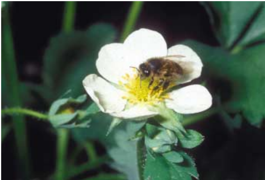
Tijdens de bloei van aardbeien is vocht nodig voor de productie van nectar.

Voor een optimale nectarproductie moeten de planten tijdens de bloeiperiode over voldoende vocht kunnen beschikken. Uit onderzoek en uit de praktijk is gebleken dat voldoende vocht van belang is voor een goede bestuiving.