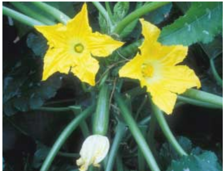
Mannelijke (links) en vrouwelijke bloem van courgette.

Het type bloem is van grote betekenis voor de bestuiving. Zo kan onderscheid worden gemaakt tussen tweeslachtige bloemen zoals paprika en aardbeien, waarbij in elke bloem zowel stamper(s) als meeldraden aanwezig zijn en eenslachtige bloemen zoals courgette.