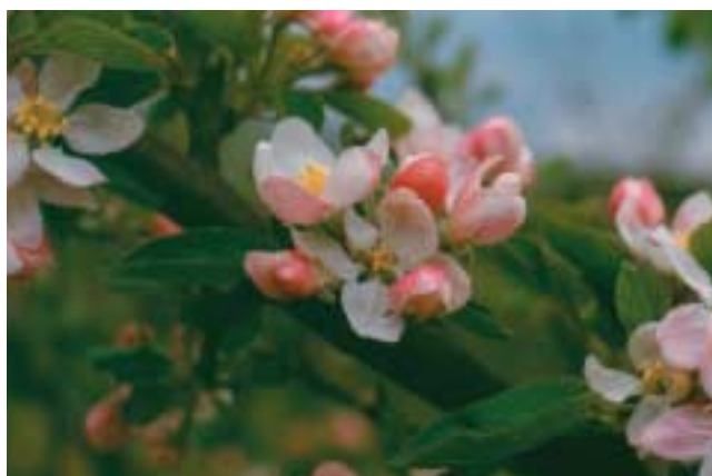
Appelbloemen zijn ingericht om bestuivende insecten te lokken.

Stuifmeel wordt gevormd in de helmknoppen van de meeldraden. Als de helmknoppen rijp zijn komt het stuifmeel vrij. Bestuiving is het overbrengen van stuifmeel van de meeldraden naar het kleverige stempeloppervlak van de stamper. Voordat de bevruchting plaats kan vinden moet de pollenbuis, die uit de stuifmeelkorrel groeit, door de stijl van de stamper naar het vruchtbeginsel groeien. Uit de stuifmeelbuis komen 2 mannelijke geslachtscelkernen; één versmelt met de eicel tot het embryo of de kiem. De tweede celkern versmelt met 2 poolkernen tot het endosperm dat het reservevoedsel vormt in het zaad. Het gehele vruchtbeginsel groeit uit tot vrucht.