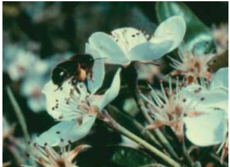
Honingbij op perenbloem, de nectar van deze bloemen bevat slechts 10 tot 20% suikers, bij appel is dat ongeveer 45%. Perenbloemen leveren wel veel stuifmeel.

Parthenocarpie is vruchtzetting zonder zaadzetting. De vorm van de vruchten laat dan vaak te wensen over. Het is niet duidelijk of bestuiving in zeer geringe mate nodig is als prikkel voor zaadloze vruchtzetting. Parthenocarpie komt bij peren regelmatig voor, vooral bij het ras 'Conference'.