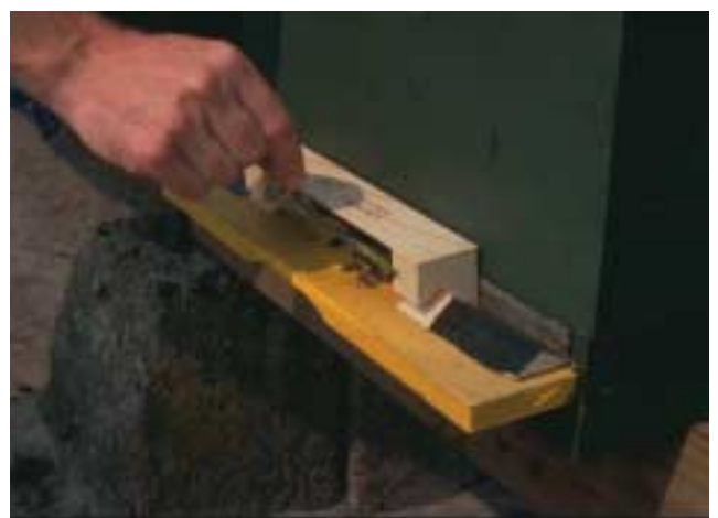
Breng tijdens de bijenvlucht iedere twee uur stuifmeel aan in de BeeBoosters.

Bij appel komt bacterievuur nauwelijks voor. Als er aantasting bij appel optreedt gaat dit voornamelijk via scheutinfectie. Daarbij spelen de bijen geen rol.