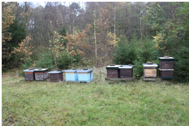
Dadtanks op de winterstand in het Kwekerbos.