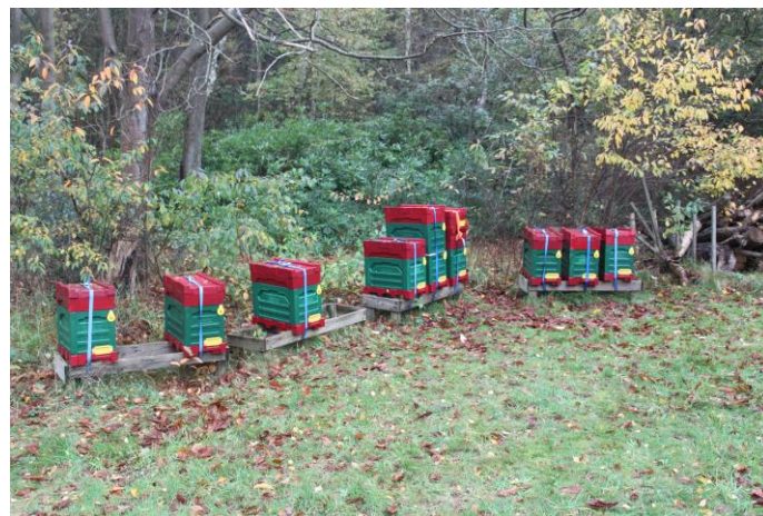
Finse 6-ramers op de winterstand in het Kwekerbos.

Er is altijd discussie geweest over standbevrucht of raszuiverbevrucht voor de koninginnen in de darrenvolken. Op grond van literatuurgegevens is er gekozen voor standbevruchtiging. Vanwege de genetische diversiteit van de darren waarmee de koninginnen gepaard zijn, is het te verwachten dat de darren in de darrenvolken een betere verzorging zouden kunnen krijgen. De werksters hebben immers genetisch nogal verschillende vaders en kunnen dan hun taken beter vervullen.